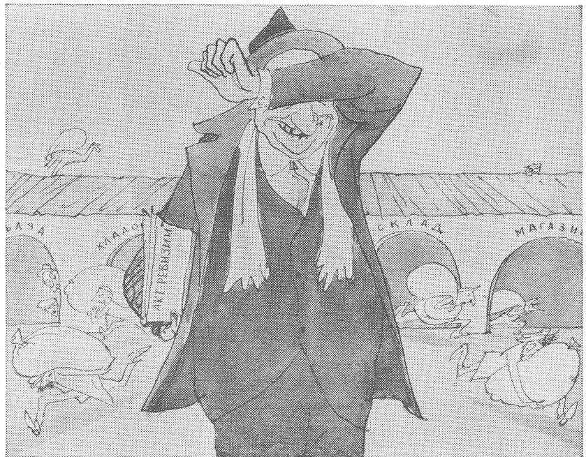
Eine Karikatur von «Krokodil» (Moskau) aus dem Jahre 1963. Der Revisor spielt Verstecken: «Eins, zwei, drei, ich komme ...»

Ich hoffe, auf dieser sumpfigen Grundlage mit Entschiedenheit die Lüge widerlegt zu haben, dass der Aufbau des Sozialismus die schöpferische Erfindungskraft des Menschen nicht genügend fördere. Das Gegenteil trifft zu, was auch die weitere Entstehungsgeschichte unserer Ställe belegen kann. Davon mehr im nächsten Kapitel. (Fortsetzung folgt)