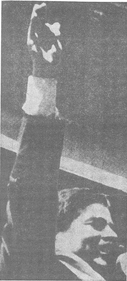
Bolivians Generalpräsident Torres: «Die Reichen haben von der Revolution nichts zu erwarten.» Aber haben die Armen etwas zu erwarten?

einschliessen sollte, erklärten mehr als die Hälfte (52,8 %) der 1173, die ihren Fragebogen beantwortet zurückschickten, dass sie zu einer «freundschaftlichen Zusammenarbeit» mit den Marxisten bereit sind, während ein grosser Teil der restlichen (36,8 %) zwar die marxistische Ideologie ablehnt, aber zum «Dialog» mit den Marxisten bereit ist.