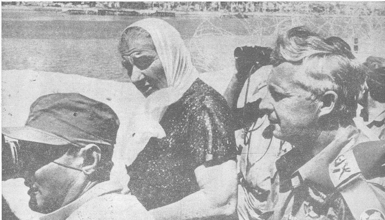
Dayan, Golda Meir und Verteidigungsminister Sharon. Besorgter Blick über den Suezkanal.

Bibliothek der Hochschule Eidg. Techn. Hochschule Leonhardstr. 33 8006 Zürich