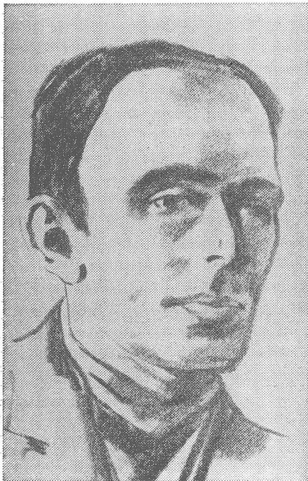
Ossip Mandelstam 1923.