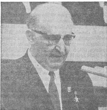
Todor Schiwkoff beim Verlesen seines Rechenschaftsberichtes: Offenes Bekenntnis zum Vasallentum.

Im Mittelpunkt des ersten Tages des Kongresses stand der von Todor Schiwkoff vorgetragene, sechsstündige Bericht des ZK der KPB. Die Schwerpunkte galten folgenden Themen: bulgarische Aussenpolitik und internationale Lage, wirtschaftliche Entwicklung des Landes vom 9. zum 10. Parteikongress, 6. Fünfjahrplan 1971—1975, Entwurf der neuen bulgarischen Staatsverfassung, Änderungen des Parteistatutes und das neue Programm der KP Bulgariens.