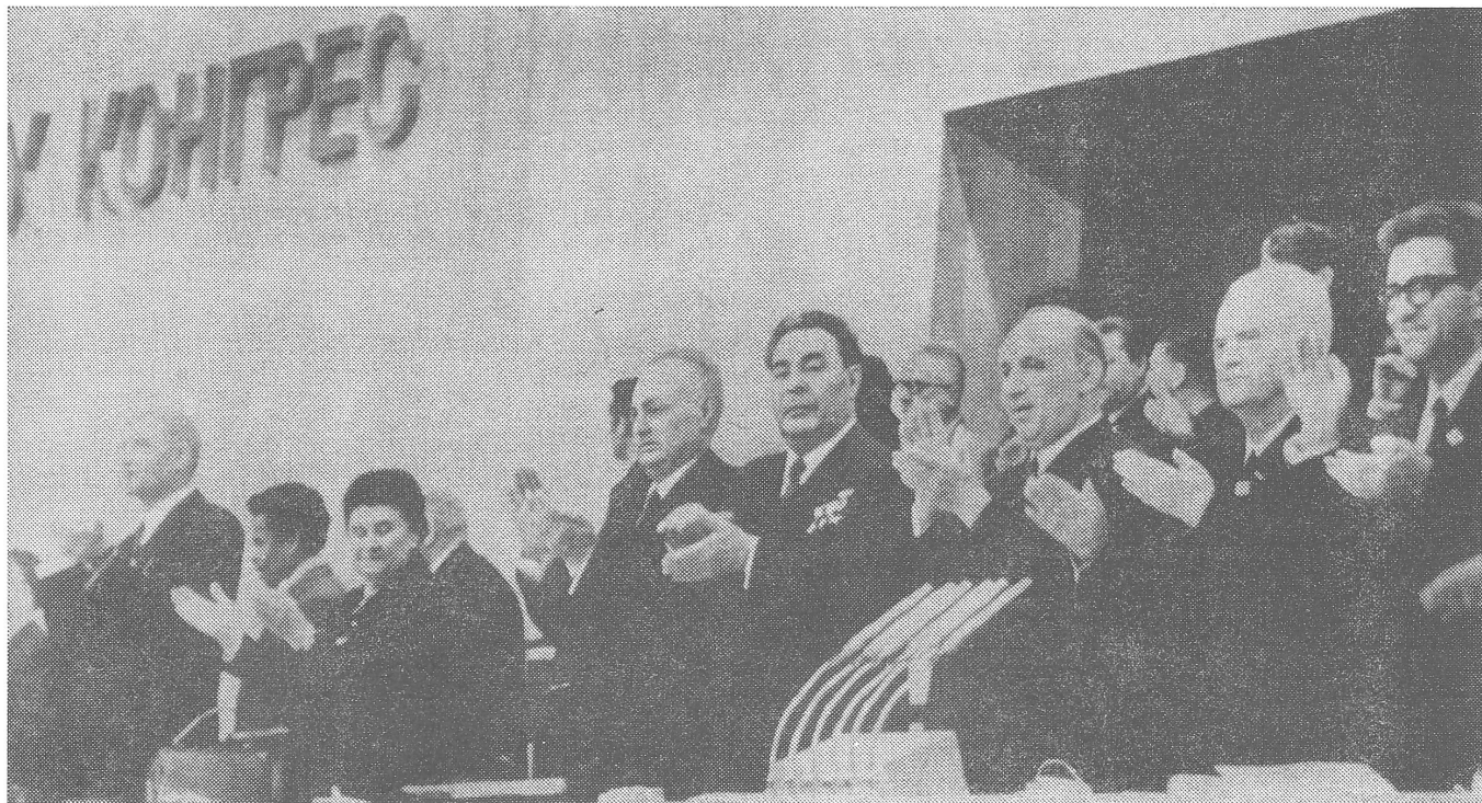
Breschnew im Kreis der Palladine: Den Applaus diktiert der «Gast».