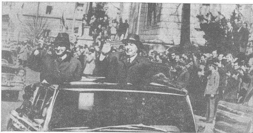
Schiwkoff und Breschnew fahren zum Kongress: Der Bevölkerung den Schutzherrn vorstellen.

Die Produktivkräfte sollen durch eine aktivere Beteiligung der Volksrepublik Bulgarien an der sozialistischen Wirtschaftsintegration weiter entwickelt werden. Die wichtigste Aufgabe besteht in der Koordinierung der Wirtschaftspläne Bulgariens mit jenen der UdSSR und anderer sozialistischer Länder. Das Land soll während des sechsten Fünfjahrplanes beschleunigt industrialisiert werden. Die Industrieproduktion soll um 55 bis 60 Prozent erhöht werden, vorweg durch die Steigerung der Arbeitsproduktivität. Auch die Energiewirtschaft muss rascher entwickelt werden. Bis zum Ende des sechsten Fünfjahrplanes soll das erste bulgarische Atomkraftwerk mit einer Kapazität von 880 MW in Betrieb genommen werden. Schon zu Beginn des Fünfjahrplanes ist eine Hochspannungsleitung zwischen der UdSSR und Bulgarien in