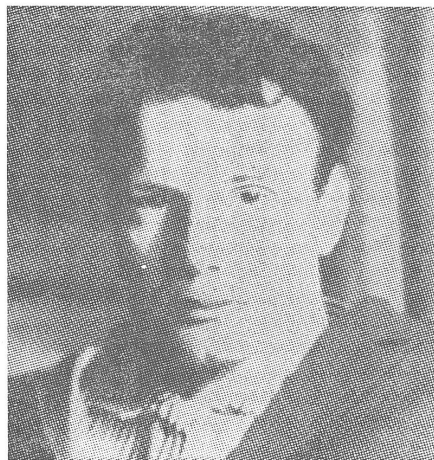
Wladimir Bukowskij, Opfer der neuen Irrenhaustaktik. Siehe Beitrag von Valerij Tarsis auf Seite 9.

ken zu einer neuen Expertise schicken. Auf diese Weise sitzt der «aus der Haft Entlassene» in Einzelhaft und wartet auf den Gerichtsentscheid. Dieser erfolgt nie vor Ablauf eines Monats. Aber für die Kranken wäre es eine Riesenfreude, wenn es mit einem Monat Einzelhaft getan wäre. Nachdem ihn das Gericht zur Zwangsbehandlung (sagen wir, nach Leningrad) zu schicken beschlossen hat, bleibt der Kranke weiterhin in Einzelhaft. Nach der Gerichtsverhandlung gehen 1, 2, 3 Monate dahin, und er sitzt immer noch. Ihm und seinen Verwandten wird erklärt, es gebe im Krankenhaus angeblich keinen Platz. Tatsächlich gibt es im Krankenhaus immer Plätze, und dies ist nichts anderes als ein Vorwand zur bewusst berechneten Quälerei von Menschen, die offiziell für unzurechnungsfähig erklärt worden sind, d. h. die keine Verantwortung tragen für ihre Handlungen, Menschen, die nicht nur unter keiner Strafe stehen, sondern sogar formell von ihr befreit wurden!