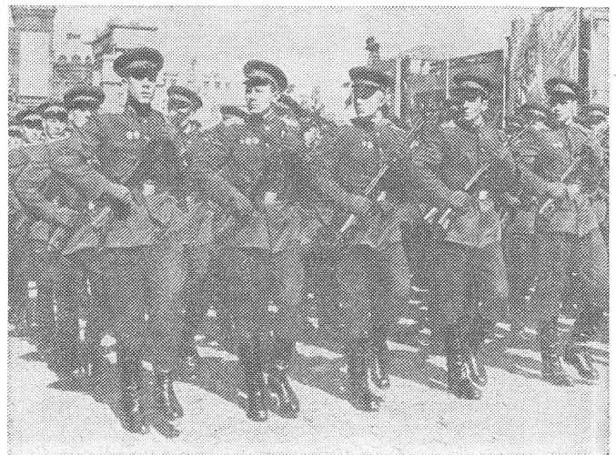
Laut Gretschko hat die Armee auch die Aufgabe, die innenpolitische Linie der Partei zu unterstützen.

Gretschko beendete seine Ansprache mit der Erklärung, dass die Sowjetstreitkräfte bereit seien, nicht nur den «Imperialismus zu zügeln», sondern auch ihre «internationalistische Pflicht» gegenüber den Werktätigen der sozialistischen Länder jederzeit zu erfüllen. Zumindest seit dem August 1968 wird dieser Hinweis als die schärfste Drohung an die «Freunde und Brüder» verstanden, die durch die Dezember-Unruhen in Polen eine neue Aktualität erhalten hat. Er ging dann aber weiter und versprach die Hilfe der sowjetischen Streitkräfte in Asien, im Nahen Osten und sogar in Afrika ganz im Sinne des weltweiten Engagements seines Landes. ■