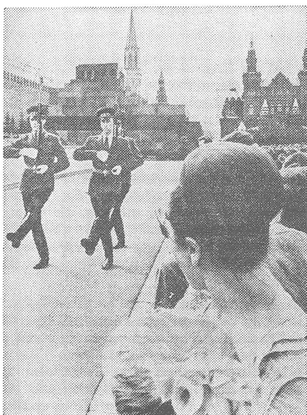
Impression vor der Kremelmauer.