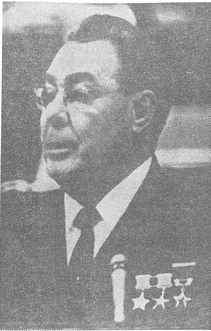
Breschnew: Vom ersten Mann der Kollektivführung immer mehr zum Chef.

Der ukrainische ZK-Bericht entdeckte ideologische Abweichungen hauptsächlich bei politisch unerfahrenen jungen Literaten, manchmal aber auch bei älteren, bekannten Persönlichkeiten. Er prangerte die nihilistische Einstellung gegenüber den grossen Errungenschaften des Sowjetvolkes an und verlangte, dass ins Zentrum der ganzen schöpferischen Arbeit der Heroismus des kommunistischen Aufbaus gestellt werde (Prawda Ukrainy, 16. 3. 71). Wie der kasachische ZK-Bericht hervorhob, können durch ideologisch unrichtige Werke fremde Anschauungen ins Bewusstsein der Sowjetmenschen gelangen (Kasachstanskaja Prawda, 25. 2. 1971). Nicht nur der ukrainische, sondern auch der lettische ZK-Bericht (Kap. IV) beschuldigte in erster Linie die schöpferische Jugend der Verdrehung der Klassenpositionen und Entstellung der Klassenlinie (Sowetskaja Latwija, 26. 2. 1971).