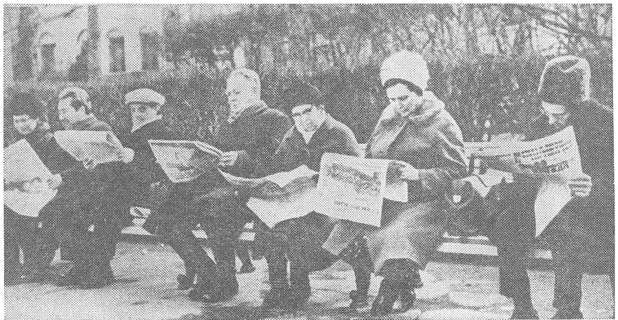
Bevölkerungsinteresse am Kongress laut offizieller Fotodokumentation.

Merkwürdigerweise gibt man jetzt der atheistischen Propaganda nicht so grosse Bedeutung wie früher; es waren nur die ZK-Berichte von Lettland, Aserbajdschan, Estland und Usbekistan, welche die Förderung der weltlichen Zeremonien (anstelle der kirchlichen) und die Ausdehnung der atheistischen Kampagne verlangten.