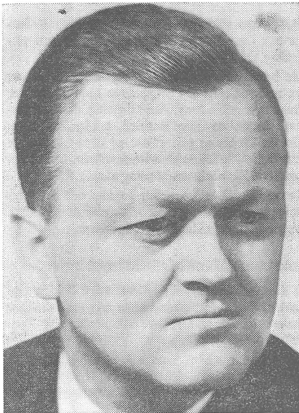
Der stalinistische Novotny-Freund General Sejna. Er provozierte Dzurs «Reformgesicht».

Das war eine gezielte Irreführung des tschechoslowakischen Volkes und der Weltöffentlichkeit. Noch eine Woche zuvor hatte Dzur in Presse, Radio und Fernsehen die bevorstehende «Unterbringung» von Truppen des Warschauer Paktes, insbesondere sowjetischer Einheiten, auf dem Gebiete der Tschechoslowakei entschieden dementiert.