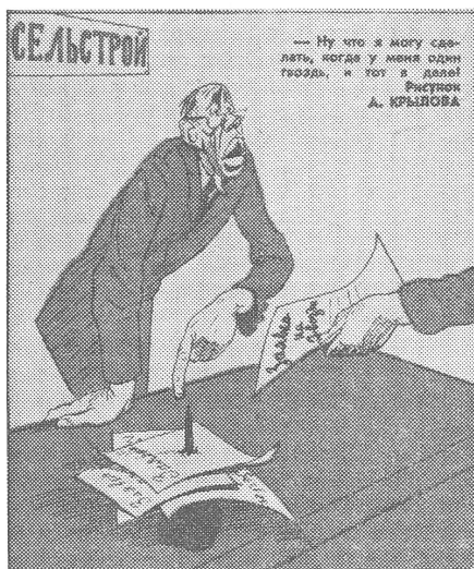
In der Baumaterialien-Abteilung: «Nägel wollen Sie? Sehen Sie denn nicht, dass ich den Nagel selber brauche?» (Zum Aufspießen der Bestellungen für Nägel.) («Krokodil», Moskau)