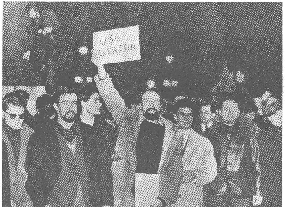
■ Antiamerikanische Demonstration in Paris: Marionetten an nicht mehr so unsichtbaren Fäden.

Element des exotischen Appells Rotchina begünstigt haben; die Begegnung zwischen Ost und West ist noch immer aufgegeben. Hierzu hat allerdings die Neue Linke nur einen scheinbaren Beitrag geleistet. Sie hat auf merkwürdige Weise nachvollzogen, was im Russland des ausgehenden 19. Jahrhunderts mit der Entwicklung des Bolschewismus vorweggenommen worden ist: die Verbindung westlicher Ziele mit östlichen Mitteln. Die historisch korrekte Begegnung dürfte indessen in der Verbindung westlicher Mittel mit östlichen Zielen liegen, um auf diese Weise westliche Rationalität im Handeln mit östlicher Emotionalität im Denken in eine neue Harmonie zu führen.