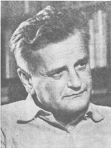
Der tschechoslowakische Kommunist Ladislav Mnacko: Ist die Sowjetunion die Heimat aller Internationalisten? «Von dieser Fiktion, von dieser Krankheit waren die Kommunisten aller Länder angesteckt.»

listischen Internationalismus» erfolgt laut chinesischer Darstellung aus Alibigründen zur Tarnung des sowjetischen Imperialismus, Kolonialismus und Faschismus. Damit ist auch von seiten der grössten kommunistischen Partei der Welt die Verwendung dieses Begriffes als blosses Instrument der spezifischen Interessen sowjetischer Machthaber bezeugt.