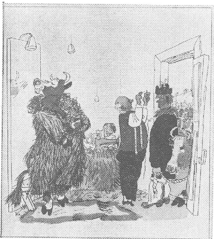
«Nur ruhig, nur ruhig. Ich werde ihr (der Kuh) einen neuen Pelzmantel machen, dass sie vor keinem Kuhstall mehr Angst zu haben braucht.»