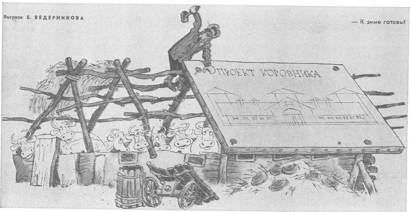
Auf den Winter vorbereitet. (An die Stelle des Dachs tritt vorderhand das Projekt für neue Stallungen.)

Herausgeber: Schweizerisches Ost-Institut • Domizil: Jubiläumsstrasse 41, CH - 3000 Bern 6 • Telephon 031 43 12 12 • Telex: 32 728 • Telegramm: Schweizost • Redaktion: Peter Sager, Christian Brügger • Mitwirkung: Die wissenschaftlichen Mitarbeiter des Ost-Instituts und Auslandskorrespondenten • Administration und Inseratenverwaltung: Peter Dolder • Druck: Verbandsdruckerei AG Bern • Jahresabonnement Fr. 24.— (Ausland Fr. 26.—; DM 24.—), Halbjahr Fr. 13.— (Ausland Fr. 14.—; DM 13.—), Einzelnummer Fr./DM 1.— • Insertionspreise: Gemäss Inseratenpreisliste Nr. 3 • Postcheck ZeitBild 30-24 616 • Banken: Spar + Leihkasse Bern, Konto 153.400.50; Deutsche Bank, Frankfurt a. M., Konto 78-2409.