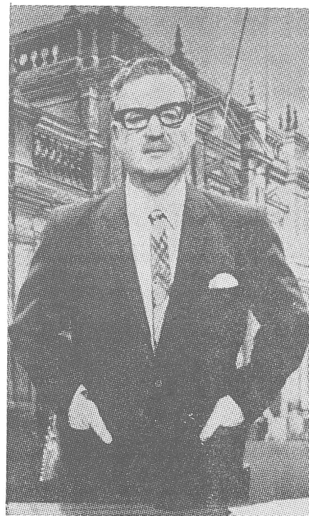
Chiles Präsident Allende: Führer oder Geführter?

In Moskau ist man bestens über diese Schwächen der Lateinamerikaner im Bilde. Daher das zweigleisige Vorgehen des Kremles: Einerseits werden beispielsweise der brasilianischen Militärdiktatur grosse Warenkredite (100 000 Dollar) angeboten, und andererseits spezialisiert sich Moskau auf die