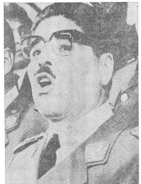
Der bolivianische Generalpräsident Juan José Torres: Ein Leben mit Putschen.