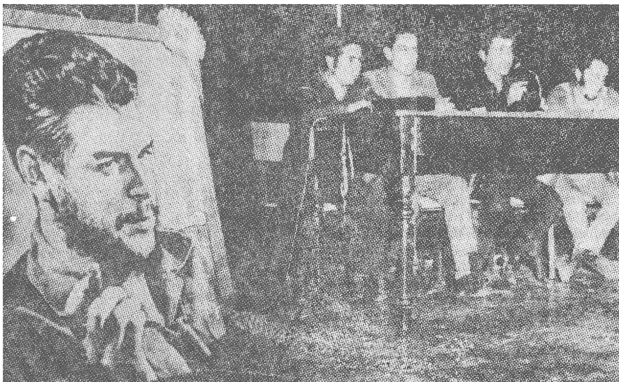
Gedenkfeier für Che Guevara in der Universität La Paz. Vor dreieinhalb Jahren war Che in Bolivien durch jene Militärs umgekommen, die ihn jetzt als Symbol der nationalen Befreiung ehren. Ob Alibi oder Bekehrung, es entspricht jedenfalls dem aussenpolitischen Kurs.

Die nachträglichen Retuschen, die Fidel Castro an der Figur des reichen Bürgersöhnchens Debray anzubringen versucht, ändern jedoch nichts an der historischen Wahrheit, dass «Che» Guevara den jungen französischen Universitätsprofessor wegen totaler Guerilla-Untauglichkeit aus seinem Partisanenlager so schnell wie möglich abzuschicken trachtete, was bei Debray übrigens keineswegs auf Opposition stiess, da er schnell bemerkt hatte, dass Guerillapredigen weniger Mühe macht als Guerilla führen. Das einzige Verdienst, das Debray nicht abzusprechen ist: er hat die Spezies der Land-, Stadt- und Luftguerillas um die der Schreibtischguerillas vermehrt. Der Lorbeer, den heute Intellektuelle um das leidende Erlöserhaupt Debrays wunden, soll einer nachträglichen Legendenbildung dienen, die jedoch durch das Tagebuch des «Che» Guevara von A bis Z dementiert wird. ■