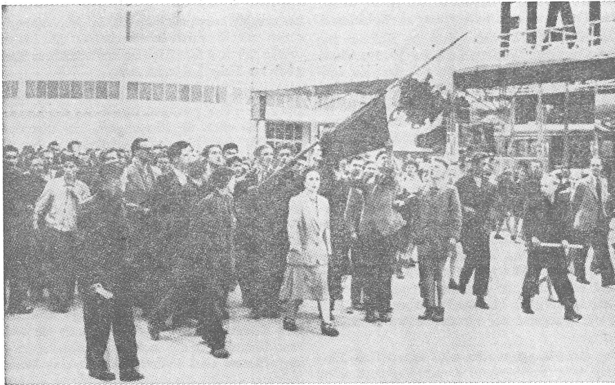
Erinnerung an den 29. Juni 1956 in Posen. Die Fahne war mit dem Blut eines getöteten Buben getränkt.

men des ersten Stockes. Die Inspektion zeigt im ersten und dritten Stock sechs Einschläge von Kugeln, die von der Strasse aus abgefeuert worden waren.