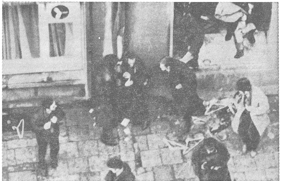
Plünderer in Gdansk. Das gab es. Aber was machte das sichtbar?

Gdynia, 17.30 Uhr. Im Hafen von Gdynia wird der Ausstand nunmehr total. (Zuvor hatten in einzelnen Sektoren noch mehrere Dutzend Dok-