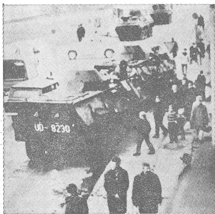
In Gdansk wie hier in Szczecin: Mit Panzern die Arbeiter überzeugen.

ker gearbeitet.) Die Docker erklären, sie würden fordern, was ihnen zustehe, ohne deswegen Sabotage oder Zerstörungen im Hafen zu dulden. Gegen 14 Uhr hatte die Miliz aus dem Hafensbereich zwei betrunkene Arbeiter abgeführt, die sich im Besitz von Molotowcocktails befanden. Es kommt zu einem Versuch, die Wasser- und Stromzufuhr abzustellen, doch werden alle Einrichtungen sichergestellt.