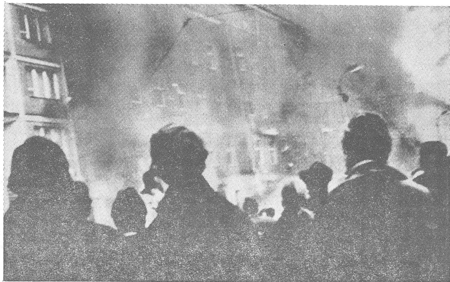
Brennende Polizeizentrale in Szczecin (Stettin). In Gdansk ging es beim Sturm auf das Milizhauptquartier laut dem polnischen Bericht äusserst knapp an einem Blutbad unter den Demonstranten vorbei.