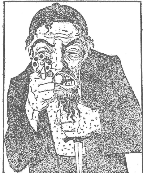
Russische Karikatur von 1907: Hässlicher Jude bewaffnet. Prototyp für die heutige sowjetische Karikatur.