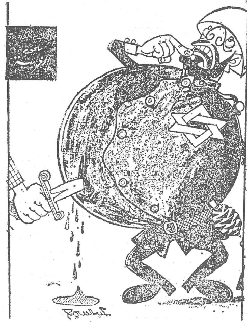
Aus der Wochenzeitschrift «Roz el Juszuf», Kairo. Das übertrifft an Grausamkeit sogar die Vorstellungen der einstigen Nazi-Karikaturisten.

Herausgeber: Schweizerisches Ost-Institut • Domizil: Jubiläumsstrasse 41, CH - 3000 Bern 6 • Telefon 031 43 12 12 • Telex: 32 728 • Telegramm: Schweizost • Redaktion: Peter Sager, Christian Brügger • Mitwirkung: Die wissenschaftlichen Mitarbeiter des Ost-Instituts und Auslandskorrespondenten • Administration und Inseratenverwaltung: Peter Dolder • Druck: Verbandsdruckerei AG Bern • Jahresabonnement Fr. 24.— (Ausland Fr. 26.—; DM 24.—), Halbjahr Fr. 13.— (Ausland Fr. 14.—; DM 13.—), Einzelnummer Fr./DM 1.— • Insertionspreise: Gemäss Inseratenpreisliste Nr. 3 • Postcheck ZeitBild 30-24 616 • Banken: Spar + Leihkasse Bern, Konto 153.400.50; Deutsche Bank, Frankfurt a. M., Konto 78-2409.