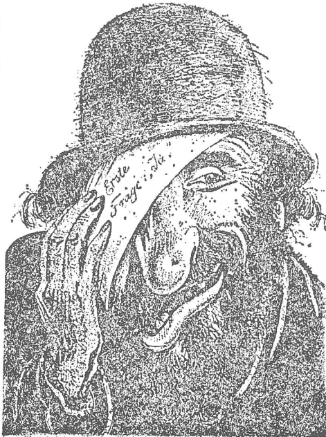
Die klassische anti-semitische Karikatur der deutsch-österreichischen Schule: Hässlicher Jude.