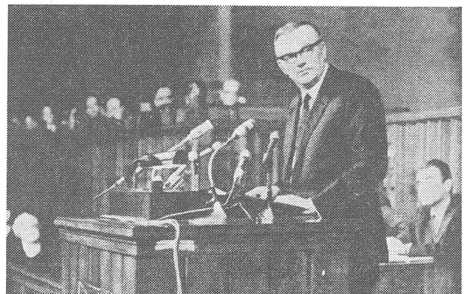
Ministerpräsident Jaroszewicz vor dem Sejm (Parlament)

Ohne jeden Vorbehalt stellte sich ihrerseits die Armeezeitung «Zolnierz Wolności» (23.12.1970, Leit- und Redaktionsartikel) hinter das Eingreifen der Armee, das Dutzenden von Zivilperso-