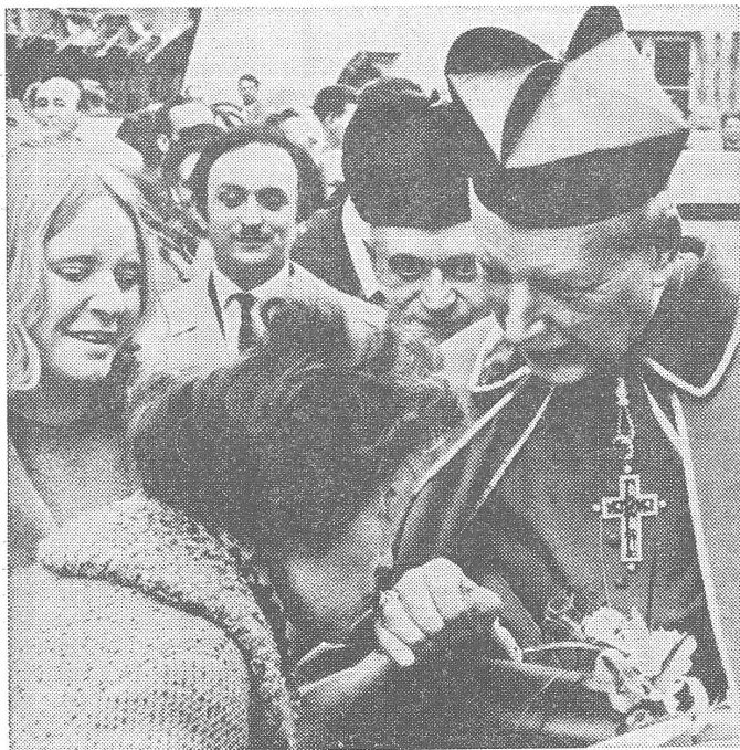
Kardinal Wyszyński. Hinter dem traditionellen Auftreten eines Kirchenfürsten steht die zeitgemässe Forderung nach Menschenrechten.

In Polen, wo die katholische Religion zwischen dem deutschen Protestantismus und der russischen Orthodoxie historisch auch zu einer Art Nationalbekenntnis geworden war, ist die Kirche noch immer eine politische Macht.