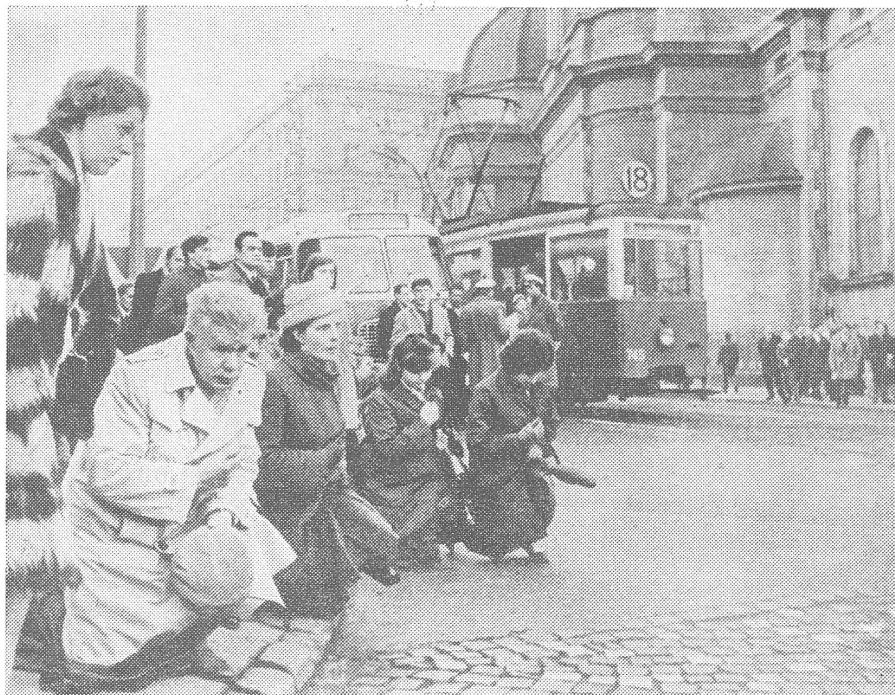
In Warschau findet die Osterprozession noch immer auf den Strassen statt. Ist der bekennende polnische Auferstehungsglaube ...