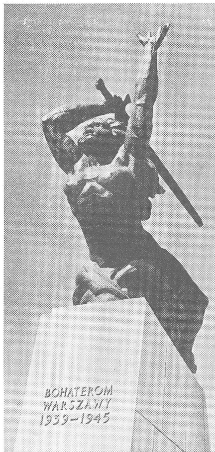
... vergeblich? (Warschauer Denkmal für die gefallenen Kriegshelden)

Bibliothek der Eids. Techn. Hochschule Leonhardstr., 33 3006 Zürich