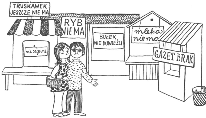
«Na endlich braucht man nicht mehr Schlange zu stehen!» (weil nirgends mehr etwas aufzutreiben ist).

Die Wirtschaftskarikaturen der satirischen polnischen Zeitschrift hielten sich bis zu den Unruhen im üblichen Rahmen der in kommunistischen Ländern erwünschten Kritik, welche nicht zu hoch zielen darf. Die akute und dramatische Zuspitzung der Lage widerspiegelten sie in keiner Weise.