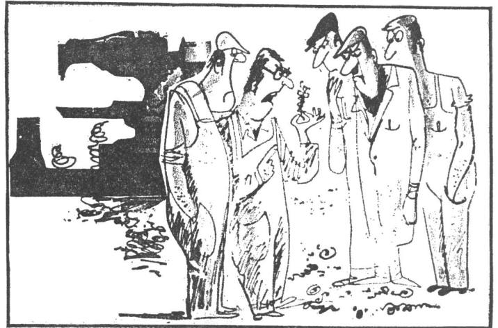
Das Argument: «Natürlich müssen wir das Fabrikationsniveau heben. Es gibt ja sonst bald nichts Brauchbares, was wir mitlaufen lassen können.»