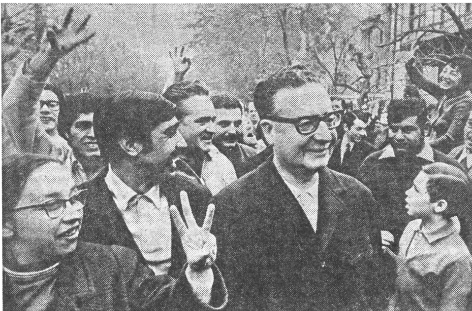
Die Zukunft wird mit Allende beschworen — aber welche?

Am besten illustriert dies das Verhältnis zu Lateinamerikas wichtigstem Wirtschaftspartner: den Vereinigten Staaten. Der Prozentsatz der lateinamerikanischen Ausfuhr in die USA ist in den letzten zwanzig Jahren von 28,3 auf 11,7 Prozent gesunken. 1969 führten die USA global viermal soviel ein wie 1950, doch die Einfuhren aus Lateinamerika haben sich in derselben Zeitspanne nicht einmal verdoppelt. Wertmässig stiegen die lateinamerikanischen Exporte nach dem US-Markt in dieser Periode um 1710 Millionen Dollar und erreichten 1969 insgesamt 4215 Millionen Dollar. Wenn Lateinamerika jedoch seine 1950 erreichte Stellung als Belieferer der USA auch 1969 eingehalten hätte, wären die Exporte auf 10 200 Millionen Dollar gestiegen. Ferner scheint es, dass die Aussichten auf ein Abbremsen des zunehmenden Anteilverlustes am wachsenden US-Markt und auf eine wesentliche Exportsteigerung für die nächste Zukunft nicht sehr günstig sind, selbst wenn die neuen protektionistischen Tendenzen in den USA sich nicht durchsetzen sollten. ■