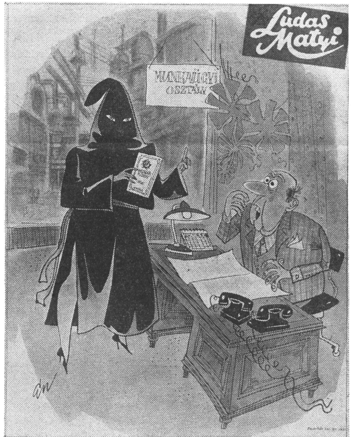
Gleicher Lohn für gleiche Arbeit? «Nein, Sie sagen mir zuerst, was mein Gehalt ist, und dann sage ich Ihnen, ob ich ein Mann oder eine Frau bin!»