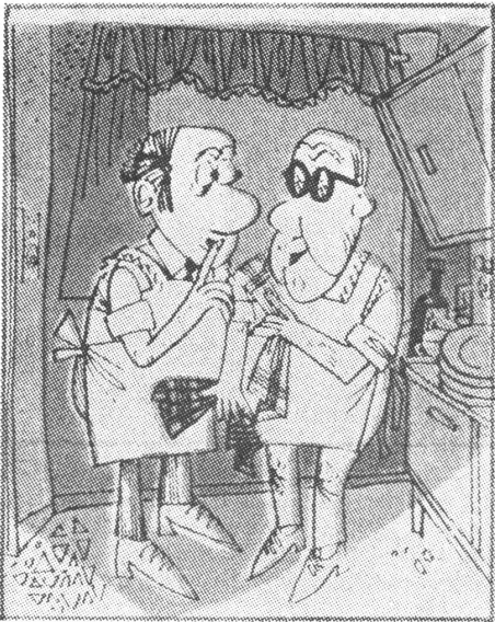
Moderner Haushalt: «Psst, meine Frau mag es nicht, wenn man in der Küche klatscht.»