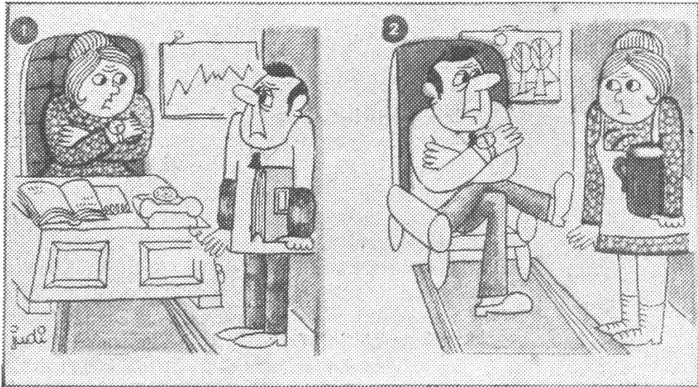
Im Betrieb die Chefin ihres Mannes, daheim ... Links sie: «Bis um fünf erbitte ich die Unterlagen!» Rechts er: «Bis um acht erbitte ich das Abendessen!»

Herausgeber: Schweizerisches Ost-Institut • Domizil: Jubiläumsstrasse 41, CH - 3000 Bern 6 • Telephon 031 43 12 12 • Telex: 32 728 • Telegramm: Schweizost • Redaktion: Peter Sager, Christian Brügger • Mitwirkung: Die wissenschaftlichen Mitarbeiter des Ost-Instituts und Auslandskorrespondenten • Administration und Inseratenverwaltung: Peter Dolder • Druck: Verbandsdruckerei AG Bern • Jahresabonnement Fr. 24.— (Ausland Fr. 26.—; DM 24.—), Halbjahr Fr. 13.— (Ausland Fr. 14.—; DM 13.—), Einzelnummer Fr./DM 1.— • Insertionspreise: Gemäss Inseratenpreisliste Nr. 3 • Postcheck ZeitBild 30-24 616 • Banken: Spar + Leihkasse Bern, Konto 153.400.50; Deutsche Bank, Frankfurt a. M., Konto 78-2409.