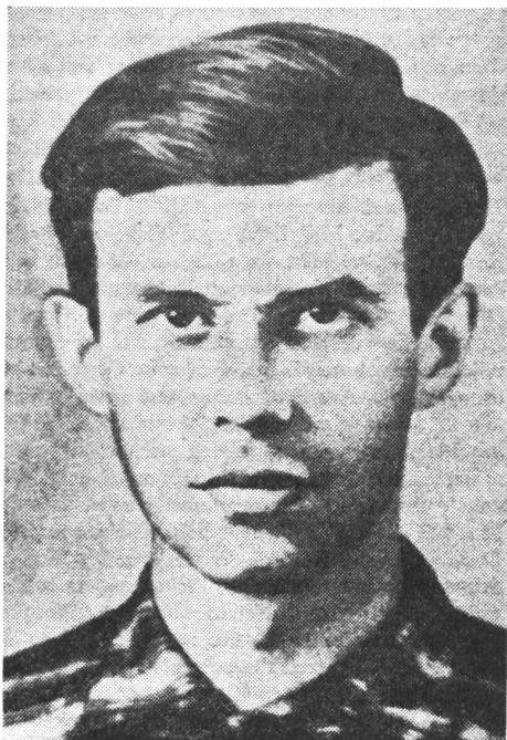
KZ-Häftling Jurij Galanskow: «Und wenn heute in deinem Land Menschen hinter Stacheldraht sitzen, die dem Ruf ihres Gewissens gefolgt sind ...»

Die Menschen in der Sowjetunion glauben aber trotzdem an das zukünftige freie Russland; sie stellen nicht bloss Mutmassungen an, sondern bereiten diese Zukunft vor.