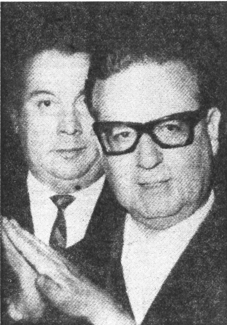
Salvador Allende: Garantie für freiheitlichen Sozialismus?

Wie diese sogenannten «fortschrittlichen Priester» es mit der Religion haben, ist schon daraus ersichtlich, dass sie eng mit den Neo-Peronisten zusammenarbeiten. Peron hat sich in den