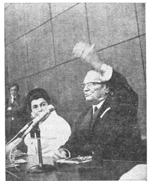
Tito (rechts bei seiner Ankündigung im Zagreber Parteiaktiv) will die Zukunft des Landes nach seinem Weggang regeln. Links Edvard Kardelj, der als erster Mann einer allfälligen kollektiven Nachfolgeföhrung im Vordergrund steht.