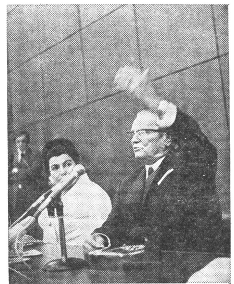
Tito (rechts bei seiner Ankündigung im Zagreber Parteiaktiv) will die Zukunft des Landes nach seinem Weggang regeln. Links Edvard Kardelj, der als erster Mann einer allfälligen kollektiven Nachfolgeführung im Vordergrund steht.