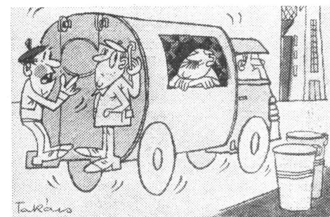
Ueberraschung bei der Kehrrichtabfuhr. «Ich habe keine Ahnung, wann er sich hier einquartiert hat.»

Herausgeber: Schweizerisches Ost-Institut • Domizil: Jubiläumsstrasse 41, CH - 3000 Bern 6 • Telefon 031 43 12 12 • Telex: 32 728 • Telegramm: Schweizost • Redaktion: Peter Sager, Christian Brügger • Mitwirkung: Die wissenschaftlichen Mitarbeiter des Ost-Instituts und Auslandskorrespondenten • Administration und Inseratenverwaltung: Peter Dolder • Druck: Verbandsdruckerei AG Bern • Jahresabonnement Fr. 24.— (Ausland Fr. 26.—; DM 24.—), Halbjahr Fr. 13.— (Ausland Fr. 14.—; DM 13.—), Einzelnummer Fr./DM 1.— • Insertionspreise: Gemäss Inseratenpreisliste Nr. 3 • Postcheck ZeitBild 30-24 616 • Banken: Spar + Leihkasse Bern, Konto 153.400.50; Deutsche Bank, Frankfurt a. M., Konto 78-2409.