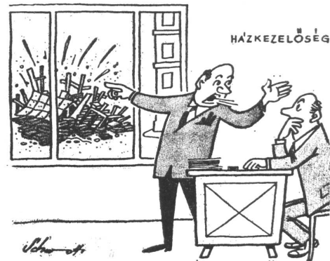
Reingewinn. «Chef, das Haus ist eingestürzt!» — «Macht nichts, wir sparen die Kosten der Renovation.»

Fünf Karikaturen zum Thema «Leben in Ungarn»: Liebe, Arbeit und Wohnung.