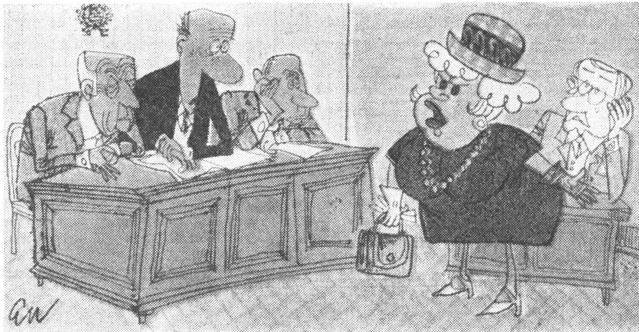
Scheidungsverhandlung. «Von Tisch und Bett kann ich mich trennen, nie aber von Wagen, TV und Kühlschrank ...»