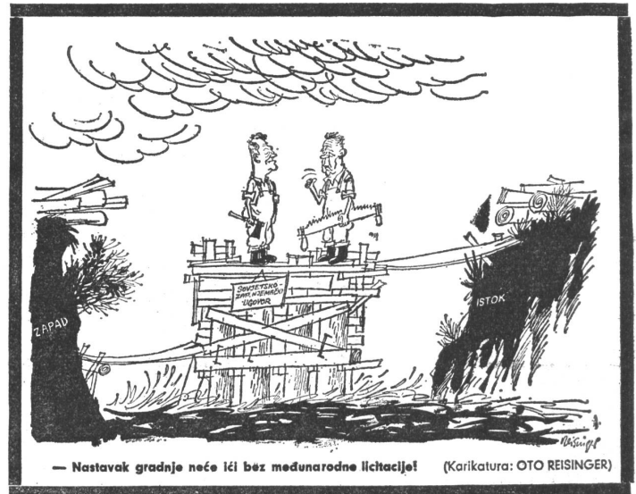
Zur Weiterführung des Baus braucht es eine internationale Ausschreibung. («Vjesnik», Zagreb)

«Wir brauchen kein besonderes Abkommen. Der Geist von Potsdam ist auch so in uns lebendig!» («Eulenspiegel», Ost-Berlin)