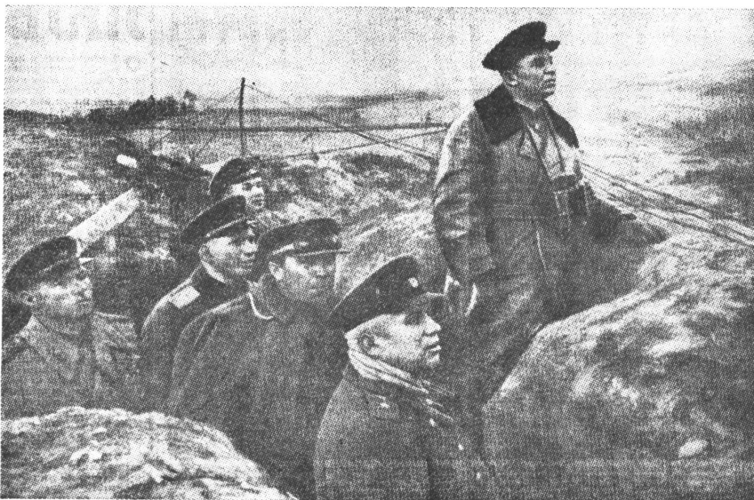
Ein Bild aus jenem gleichen Frühling 1943, als unser Autor sein «Trinkgelage» mit Chruschtschew und Watutin hatte. Die beiden Generäle sind hier (vorne, Watutin oben) auf einem Frontabschnitt bei Kursk zu sehen.

Svoboda war nicht anwesend. Er befand sich seit einer Woche in Moskau, um dort auf Grund der Fürsprache Chruschtschews bei Stalin an den