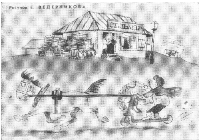
Eine Trottnettfuhre Kartoffeln vor dem Kolchoselager: «Hat man die Erntewagen immer noch nicht gebracht?»