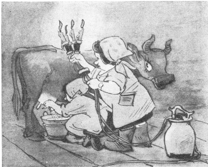
Mit Hilfe der Technik.