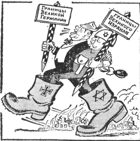
Die Grenzen Grossdeutschlands und die Grenzen Grossisraels: Zwei Stiefel machen zusammen ein Paar.

Die Ungeheuerlichkeit, Opfer und Henker des Nazismus einander gleichzustellen, hatte noch vor einigen Jahren bei ihrem ersten Auftauchen in einer antisemitischen ukrainischen Broschüre selbst bei den moskauhörigen Kommunisten des Westens Entrüstung ausgelöst (die Moskau zum Rückzug der betreffenden Broschüre veranlasste). Inzwischen gehört das Verfahren zur sowjetischen Alltagspflogenheit, mit der die Vernichtungswürdigkeit Israels «bewiesen» wird. Und die gesamte Welt hofft auf die Friedensrolle der UdSSR im Nahen Osten.