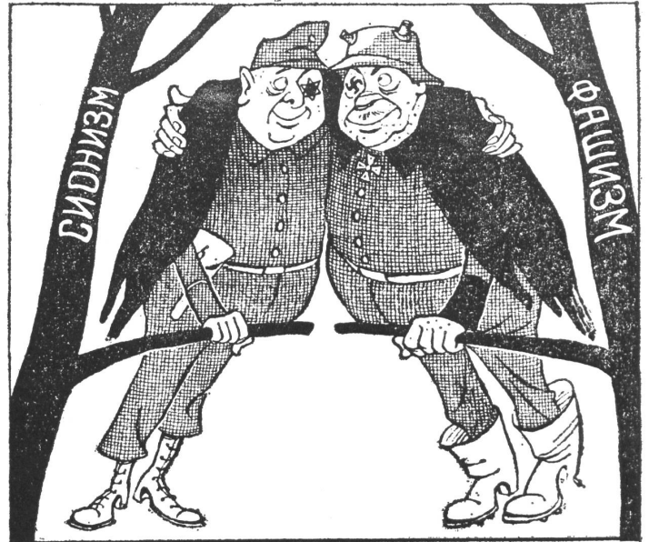
Zionismus an den Faschismus geschmiegt: Ein Rabe hackt dem andern das Auge nicht aus.

«Auf Friedenswacht» steht nach eigenen Angaben heute auch die Sowjetarmee. Aber ihre Publikationsorgane zeichnen heute das Feindbild mit den genau gleichen Mitteln wie Hitler. Ein Feindbild, das den soldatischen Hass erwecken soll und die Vernichtung bezweckt. Wir zeigen das mit Karikaturen aus der Armeezeitung «Krasnaja Swjesda» am Beispiel der Zielscheibe Israels. Aus jedem Strich dieser Zeichnungen spricht der Geist Hitlers. Das nicht zu sehen ist verbrecherischer geworden als je zuvor. Leider ist es auch modischer geworden als je zuvor.