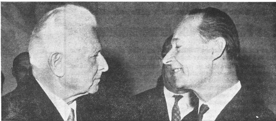
Eine Erinnerung, die bitter geworden ist. Svoboda nach seiner Ernennung zum Präsidenten am 30. März 1968 mit Dubcek. Der Parteichef des Prager Frühlings ist degradiert worden, aber der General ist Staatsobershaupt geblieben — unter dem Vorzeichen jener Macht, die seinen alten Meister Stalin wieder auferstehen liess.