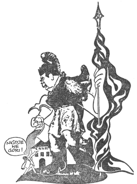
Als Ende Juli 1968 die akute Möglichkeit einer gewaltsamen sowjetischen Intervention realisiert wurde, veröffentlichte die Literaturzeitschrift «Literarny Listy», die gedankliche Vorkämpferin des Prager Frühlings, diese Karikatur. Sie zeigt Breschnew als heiligen Florian, Patron der Feuerwehr, wie er sich anschickt, den vermeintlichen konterrevolutionären Brand im tschechoslowakischen Häuschen mit einem Wasserstrahl zu bekämpfen, der auch das Häuschen selbst hinwegschwemmen muss. Der kleine Dubcek eilt heraus und ruft: «Aber es brennt ja gar nicht!»