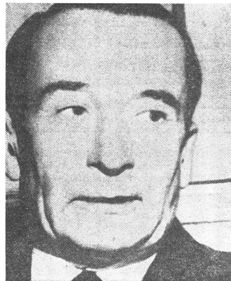
Der ehemalige Präsident Argentiniens, General Aramburu. Seine Entführung führte den Regierungsturz herbei, noch bevor seine Ermordung bekannt geworden war. Und Argentinien hat die Todesstrafe für Terroristen eingeführt.

Kaum anders werden sich vermutlich im nächsten Jahr in Chile die Ereignisse entwickeln. Die definitive Lösung der Christlich-Demokratischen Partei für den Wahlfeldzug für die im September vorgesehenen Präsidentschaftswahlen heisst: «Das chilenische Wunder durch Arbeit und nationale Solidarität» zu erreichen. Diese neue Formulierung des Leitworts der Regierung des christdemokratischen Staatspräsi-