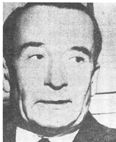
Der ehemalige Präsident Argentiniens, General Aramburu. Seine Entführung führte den Regierungsturz herbei, noch bevor seine Ermordung bekannt geworden war. Und Argentinien hat die Todesstrafe für Terroristen eingeführt.

Kaum anders werden sich vermutlich im nächsten Jahr in Chile die Ereignisse entwickeln. Die definitive Lösung der Christlich-Demokratischen Partei für den Wahlfeldzug für die im September vorgesehenen Präsidentschaftswahlen heisst: «Das chilenische Wunder durch Arbeit und nationale Solidarität» zu erreichen. Diese neue Formulierung des Leitworts der Regierung des christdemokratischen Staatspräsi-