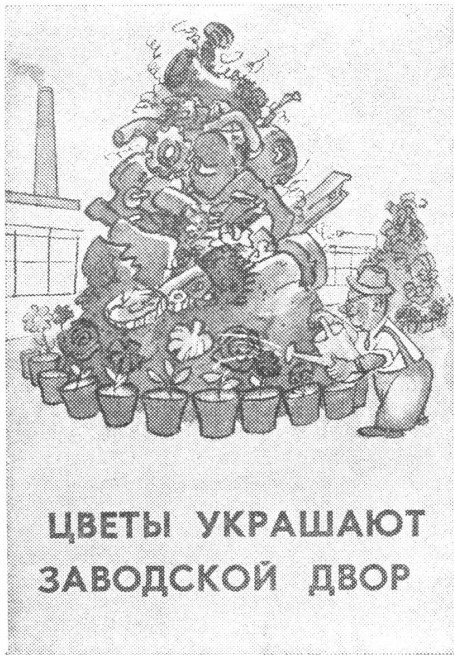
Die Schrottberge vor den Betrieben haben den Karikaturisten angeregt: «Mein Plakatvorschlag: Blumen verschönern das Fabrikareal.» («Krokodil», August 1969)

systembedingten Verzögerungen bei der Einführung neuer Technologien und Anpassungsschwierigkeiten bei den Unternehmungen werden auch hier sichtbar. Ein neues Verfahren der Ammoniakherzeugung (Hauptbestandteil des Stickstoffdüngers) erlaubt eine Kostensenkung von etwa 50 Prozent. In den USA wurde die erste Fabrik für die Produktion nach diesem neuen Verfahren 1965 gebaut; schon 1968 gründete nahezu die halbe Produktionskapazität für Ammoniak auf dieser neuen Technologie. In der Sowjetunion besteht jedoch bis heute keine Fabrik, die in der Lage wäre, Ammoniak mit diesem neuen Verfahren herzustellen.