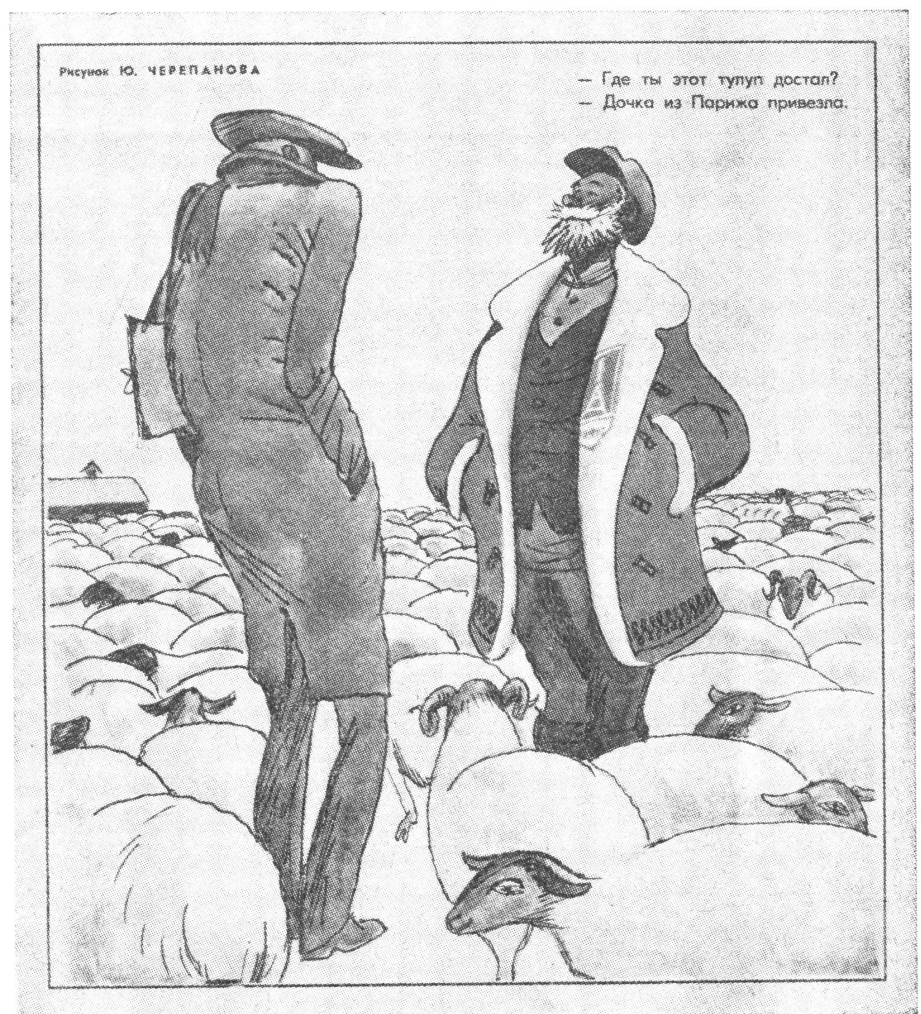
«Woher hast du denn diesen Schafspelz?» fragt der Funktionär den Schafhirten. Dass diese Frage im Reiche der Planwirtschaft nicht so überflüssig ist, zeigt die Antwort: «Den hat mir meine Tochter aus Paris mitgebracht.» («Krokodil», Moskau, Nr. 1, 1970)

Mit diesen Zahlen lässt sich nur zeigen, dass die Sowjetunion auf dem Wege der Industrialisierung voranschreitet. Sie verschweigen indessen den Preis, der für diesen Erfolg mit der Hinnahme eines anhaltend tiefen Lebensstandards bezahlt werden musste. Sie sagen nichts aus über den Aufwand, der zum Ertrag in einem möglichst günstigen Verhältnis stehen sollte. Vor allem aber: diese Zahlen erlauben nicht die geringste Prognose über die weitere Entwicklung. Daher werden wir im nächsten Beitrag einen Ueberblick über die Lage einzelner Wirtschaftszweige in der UdSSR zu geben versuchen. ■