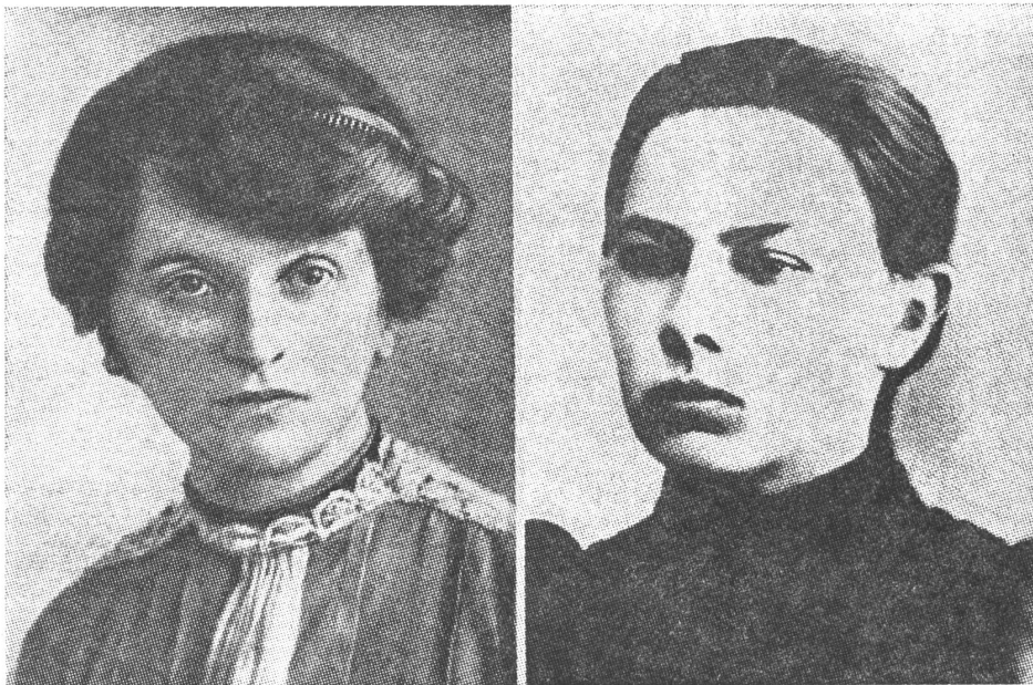
Lenins «grosse Liebe» war Inessa Armand (links), während Nadja Krupskaja (rechts) seine treue Lebensgefährtin wurde.

Die Eroberer kamen immer hoch zu Ross, an der Spitze eines siegreichen Heeres, umgeben von grosser Gefolgschaft. Wladimir Iljitsch Uljanow, genannt Lenin, hatte Galoschen angezogen und fuhr mit der Strassenbahn zum Smolny, um sich an die Spitze der Revolution zu stellen, die ausser ihm fast niemand wollte.