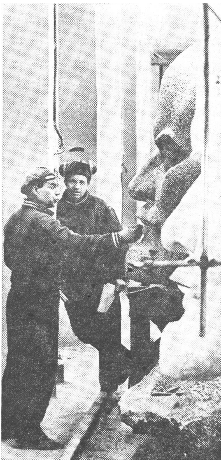
Sorgfältige Retouchen am Monument.

gewährleisten, und dieses Bestreben ist gewaltsam von aussen vereitelt worden. Es handelt sich (natürlich) um die Tschechoslowakei von 1968.