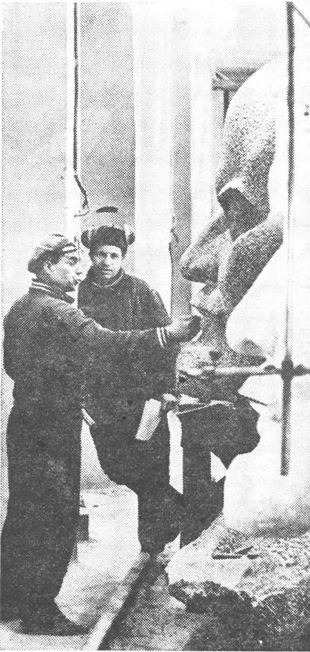
Sorgfältige Retouchen am Monument.

gewährleisten, und dieses Bestreben ist gewaltsam von aussen vereitelt worden. Es handelt sich (natürlich) um die Tschechoslowakei von 1968.