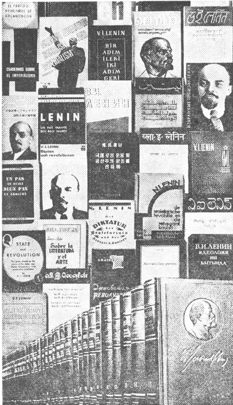
Das meist übersetzte Buch der Welt war früher die Bibel. Aber Lenins Werke haben sie längst überholt.