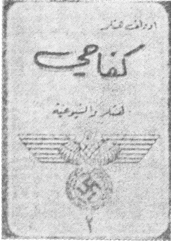
Hitlers «Mein Kampf» auf arabisch. Lehrstoff für ägyptische Schulen und palästinensische Ausbildungslager. Wer mit dieser Sache sympathisiert, sympathisiert mit dem Nationalsozialismus.