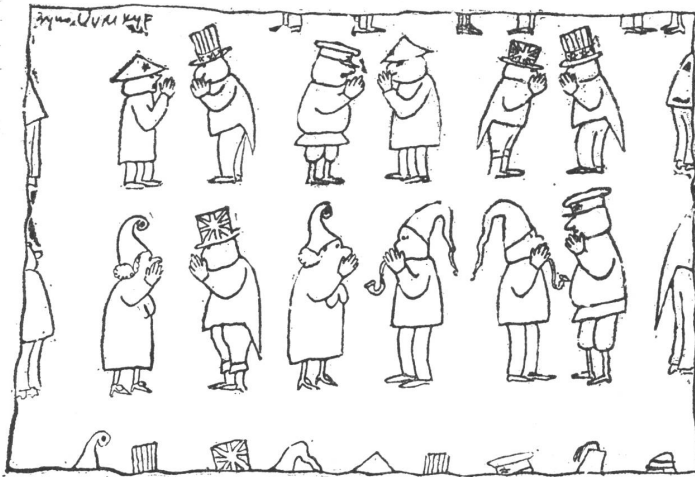
Der heutige Stand. («Politika», Belgrad)

Diese Karikatur zeigt, wo auch in Jugoslawien die Grenze zeichnerischer Angriffigkeit liegt. Der Staatschef darf nicht anders als in einem positiven Helgen dargestellt werden.