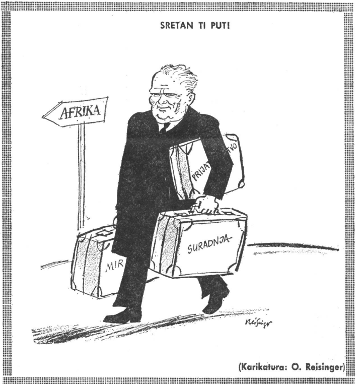
(Karikatura: O. Reisinger)

In Washington, Moskau und Peking spekuliert man gleichermassen auf den Krach zwischen den «andern». Die subsumierte Gleichheit der Situation stimmt allerdings nicht. Amerikaner und Chinesen werden von den Sowjets immer mehr in die Defensive gedrängt und hätten eigentlich ein gemeinsames Interesse daran, ihr aussenpolitisches Handeln auf diese Sachlage abzustellen.