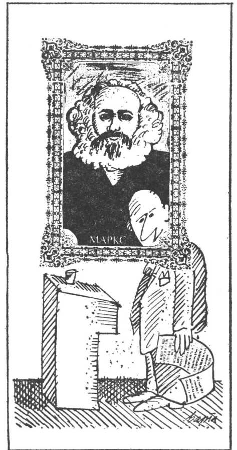
Fischer wendet sich gegen das Eindringen von Funktionären der Macht in das Bild von Marx. Karikatur «Nova Makedonija», Skopljé: «Profil eines Politikers».

Die Ausführungen Fischers über die Gründe seiner Gläubigkeit anlässlich der Schauprozesse sind lesenswert. Es bleibt natürlich ein Rest, was er übrigens selbst in erster Linie sagt. Darüber, dass Verhaftungen willkürlich erfolgten, wussten ja alle Kominternmitglieder in Moskau Bescheid. Immer wieder wird erwähnt, wie man versuchte, über Dimitroff oder andere relativ einflussreiche Leute, solches Verhängnis abzuwenden, mit wechselndem Erfolg. Es wurden zum Beispiel