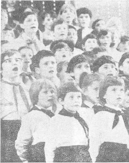
... zur Harmonie im Chor der jungen Pioniere.

gehen. Wenn der schon grössere Sohn oder die Tochter sagen würde: 'Ich will nicht in die Kirche!' soll man antworten: 'Gut, aber unterdessen mache bitte Feuer, oder bringe die Wohnung in Ordnung, bis wir hejnkehren' ... und das Kind soll gelobt werden, wenn es seine Aufgabe verrichtet hat ... Auch das Abend- und Morgengebet sollte die Privatangelegenheit der Erwachsenen sein ... das Kind sollen wir weder zur Beichte, noch zur Kommunion schicken. Diese Probleme sollen nie Themen einer Diskussion in der Familie sein ... Wir wissen, es bedarf einer grossen Selbstbeherrschung und eines grossen Vertrauens an der sozialistischen Schule, wenn die Eltern erdulden müssen, dass die Religion in der Familie abstirbt!