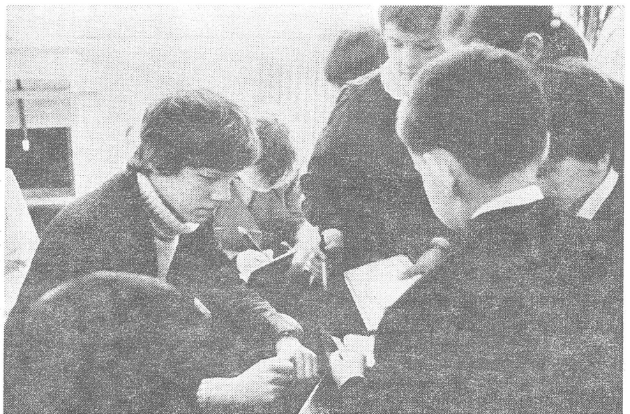
Differenzierte Methoden werden dort anempfohlen, wo die Jugendlichen in Kontakt mit dem Ausland kommen können, wie etwa bei dieser ungarisch-amerikanischen Film-Coproduktion, deren junger amerikanischer Hauptdarsteller hier seinen kleinen Fans Autogramme gibt.

«Meine Mutter war im Sommer bei ihrer Schwester in Amerika. Sie wohnen in einer 5-Zimmer-Wohnung und haben einen Wagen, TV und Kühlschrank. Die Menschen leben dort besser als wir!» (Fortsetzung auf Seite 15)