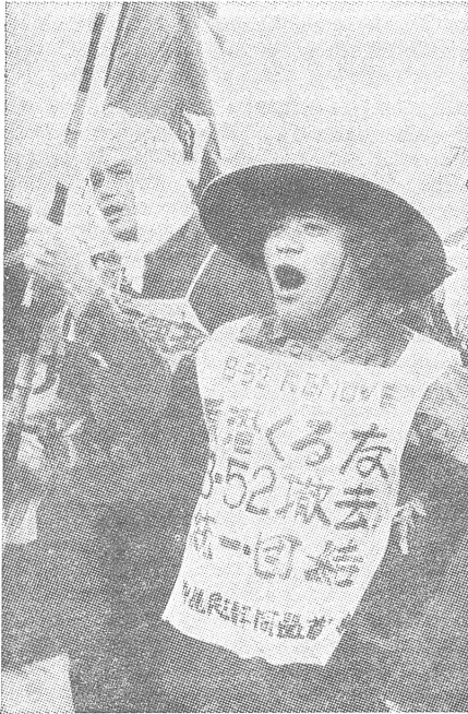
In Japan demonstrierte man mit Erfolg gegen den amerikanischen Stützpunkt auf Okinawa. Gegen die sowjetische Besetzung der Kurilen-Inseln demonstriert man nicht.

union die Sicherheit Asiens wirklich garantieren wird, und sogar mit dem Risiko eines Überengagements, ist fragwürdig. Daher kann der Standpunkt vertreten werden, dass Moskaus Appell für ein kollektives Sicherheitssystem in Asien eine seiner propagandistischen Taktiken ist, die auf die Auflösung der bestehenden «aggressiven Militärblöcke der imperialistischen Kräfte» abzielt.