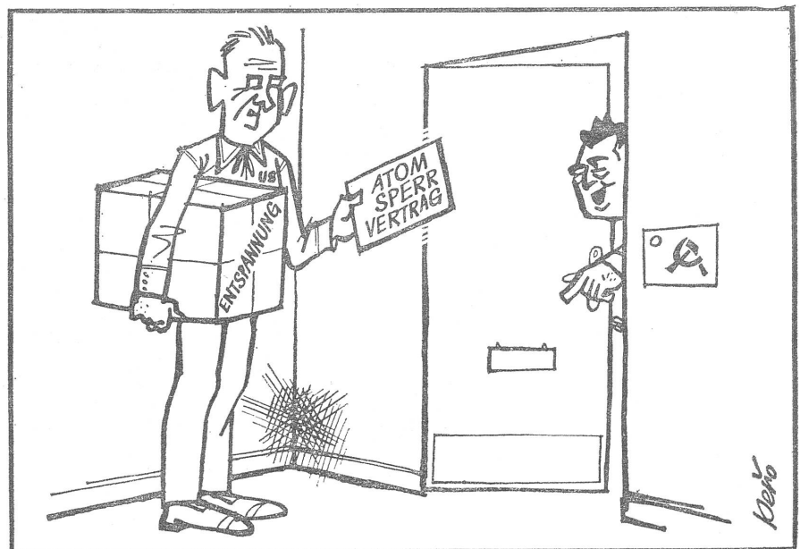
«Nur den Brief bitte, das Paket geht nicht durch den Schlietz.»