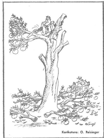
Karikatur: O. Reisinger

Diese pragmatische Folgerung hat den Nachteil, dass sie nur mit Tatsachen beweisbar, aber nicht mit Glaubenssätzen verkündbar ist. Deshalb hat sie in einem Zeitalter der Ideologisierung wenig Chancen, beachtet zu werden. Sie wird vermutlich dennoch einmal Allgemeingut sein. Spätestens dann, wenn wir ihre Richtigkeit nicht an fremder, sondern an eigener Erfahrung messen werden. Ein gutes neues Jahr! cb