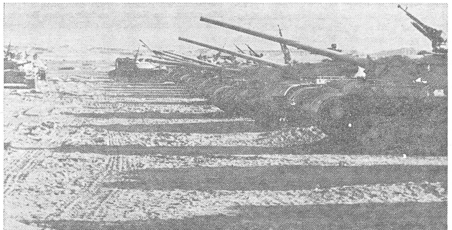
. . . und auf dem Lande statt (sowjetische T-54-Panzer in der ägyptischen Armee).