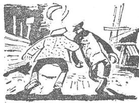
Ich bringe selbst schwankende Leute zum Bau zurück.