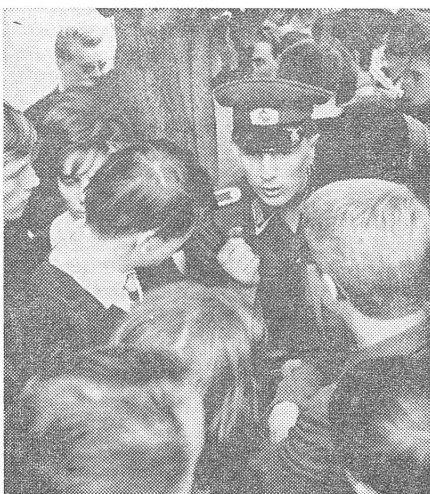
Ein Hauptanliegen in der DDR: die Militarisierung der Jugend.

«Ich ging auch ins Warenhaus Perla, um Kinderspielzeuge zu betrachten. Auf einem Regal entdeckte ich Pinguine sowjetischen Fabrikats. Es sind sehr geistreiche Spielzeuge: sie bewegen sich mit Batterien. Wenn man dann einen Knopf drückt, hebt der Pinguin seinen Flügel und macht einige Schritte vorwärts. Die Verkäuferin, die sehr mürrisch aussah, sprach ich vorerst russisch an.