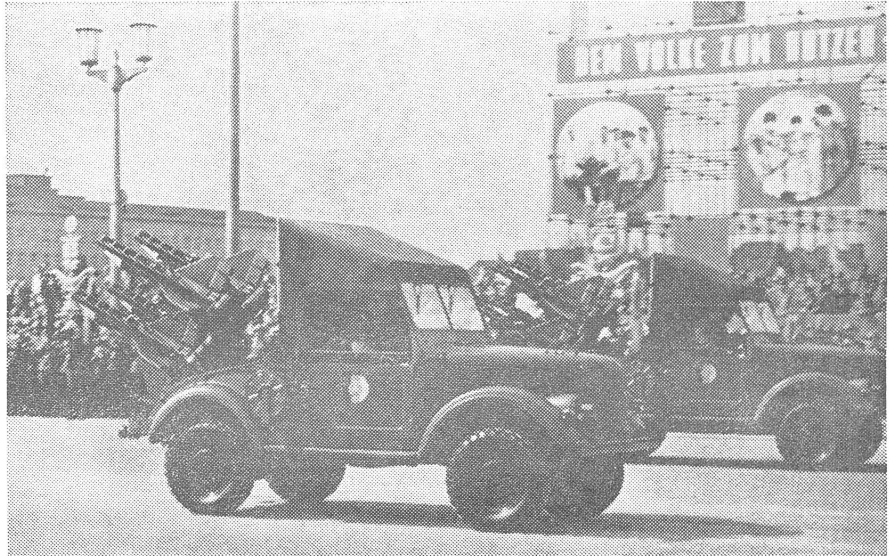
Ostdeutsche Militärparade zum 1. Mai.

Es geht somit nicht um das Gleichgewicht, sondern um die Verschiebung der Kräfte, nicht um