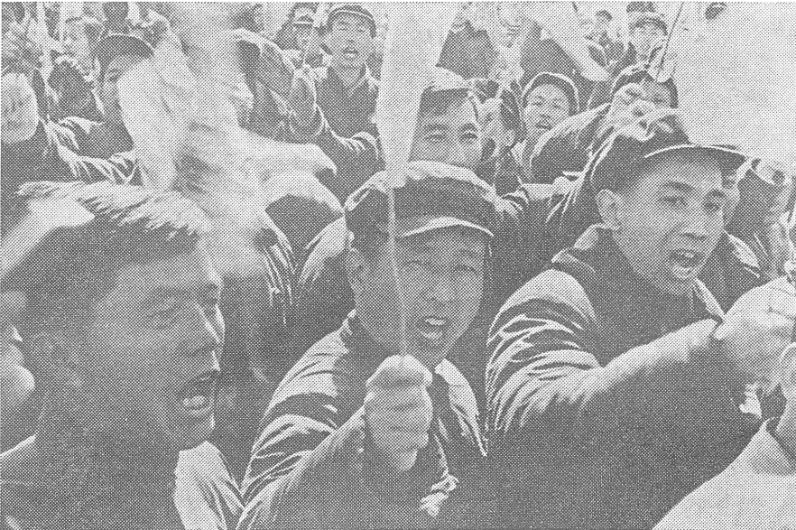
«Voll gerechter Empörung und flammendem Zorn rufen die breiten revolutionären Massen der Hauptstadt vor der sowjetrevisionistischen Botschaft entrüstet mit erhobener Faust: ‚Nieder mit den neuen Zaren!‘, ‚Nieder mit dem Sozialimperialismus der Sowjetrevisionisten!‘, ‚Wir schwören, das heilige Territorium unseres Vaterlandes mit dem Leben zu verteidigen!‘. Photo: Hsinhua. China im Bild 5/1969.»

der indonesische Kurs als direkte Komponente der Pekinger Aussenpolitik, Rebellenbewegungen in Malaysia und Thailand. Nach dem offenen Bruch mit der Sowjetunion ab 1963 erhielt die Aggressivität auch immer deutlicher ihre Einbettung in eine spezifisch chinesische Auffassung der Weltrevolution. Die Klassenkampfsituation Proletariat gegen ausbeutende Klasse wurde vor allem auf den Kampf der unentwickelten Völker gegen imperialistische Staaten umgedeutet, und China verstand sich als Vorkämpfer aller nationalen Befreiungsbewegungen. Diese spezielle chinesische Ausrichtung fasste 1965 Lin Piao in der These vom Kampf des Weltdorfes (Entwicklungsgebiete) gegen die Weltstadt (Industriationen) zusammen.