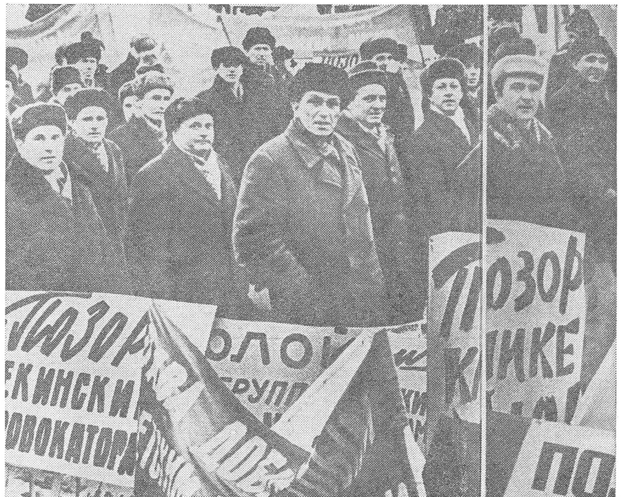
Vor der chinesischen Botschaft in Moskau. Ogonjok, 11/1969.