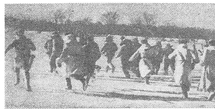
Die chinesischen Provokateure drangen gewaltsam ein und flüchteten. Ogonjok, 11/1969.

Es ist politisch keineswegs gleichgültig, wie man die Sache sieht. Gut wäre es, keine dieser im extremen Fall gegenteiligen Möglichkeiten (zu denen dazwischen- und abseitsliegende hinzukommen) aus den Augen zu verlieren und im praktischen Verhalten jene Entwicklung mit Vorrang zu berücksichtigen, die augenblicklich dominiert. Wie aber steht es in dieser Hinsicht heute mit dem westlichen Verhalten? Es geht von einem sowjetisch-chinesischen Gleichgewicht aus, das in