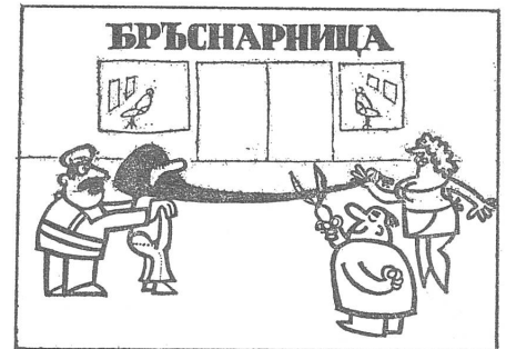
Vor dem Coiffeur. («Nardna Mladesch», Sofia)