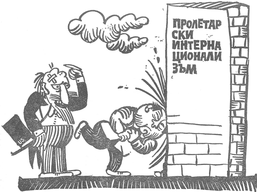
An der Mauer des proletarischen Internationalismus (sowjetischer Lesart) hat sich der amerikanische Imperialismus Beulen geholt und überlässt es nun seinem heimlichen Verbündeten, China, sich am gleichen Hindernis den Kopf einzurennen. («Starschel», Sofia)

Bulgarische Karikaturen auf vorgeschriebener Thematik