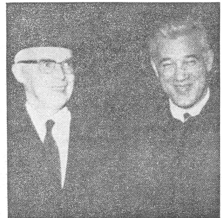
Bundesrat Spühler mit dem rumänischen Aussenminister Manescu.

Rumänien ist bereit, seine Unabhängigkeit zu verteidigen. Aber über die einsetzbaren Mittel darf man sich keine Illusionen machen.