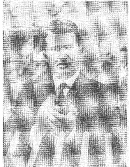
Kalkuliertes Risiko: Nicolae Ceausescu.

Schon im rumänischen Parteistatut von 1965 war die Institution der Mitgliedschaftskandidaten der Partei abgeschafft worden, die in der sowjetischen Partei seit 50 Jahren existiert, unter Berufung auf