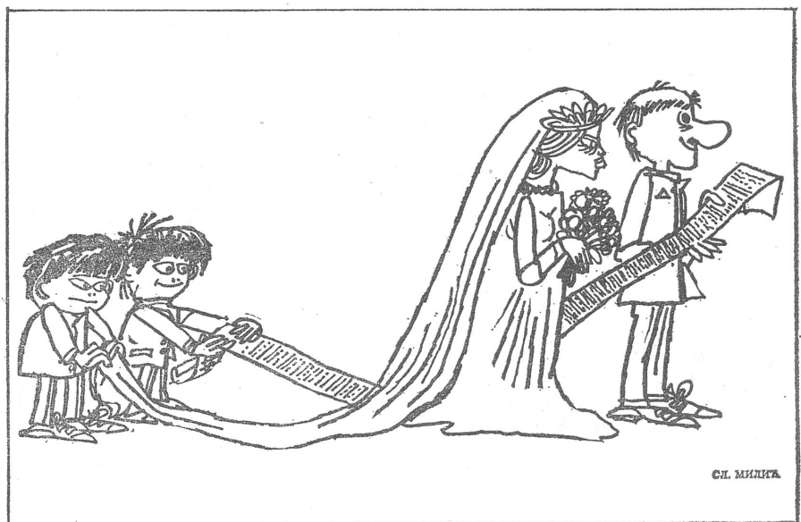
Die Hochzeit des Parteiaktivisten. («Jesch», Belgrad)