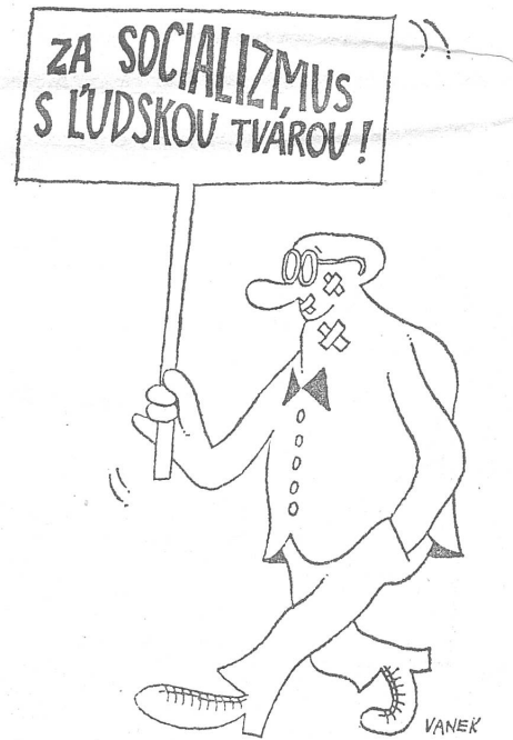
Für Sozialismus mit menschlichem Gesicht. («Literary Život», Bratislava, 17. April 1969)