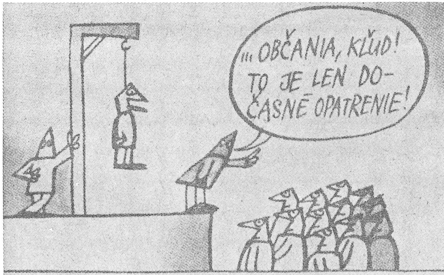
«Nur ruhig, nur ruhig, das ist doch bloss eine provisorische Massnahme.» («Rohac», Bratislava, 5. Februar 1969)

Herausgeber: Schweizerisches Ost-Institut • Domizil: Jubiläumsstrasse 41, CH - 3000 Bern 6 • Telefon 031 43 12 12 • Telex: 32 728 • Telegramm: Schweizost • Redaktion: Peter Sager, Christian Brügger • Mitwirkung: Die wissenschaftlichen Mitarbeiter des Ost-Instituts und Auslandskorrespondenten • Administration und Inseratenverwaltung: Peter Dolder • Druck: Verbandsdruckerei AG Bern • Jahresabonnement Fr. 24.— (Ausland Fr. 26.—; DM 24.—), Halbjahr Fr. 13.— (Ausland Fr. 14.—; DM 13.—), Einzelnummer Fr./DM 1.— • Insertionspreise: Gemäss Inseratenpreislste Nr. 3 • Postcheck ZeitBild 30-24 616 • Banken: Spar + Leihkasse Bern, Konto 153.400.50; Deutsche Bank, Frankfurt a. M., Konto 78-2409.