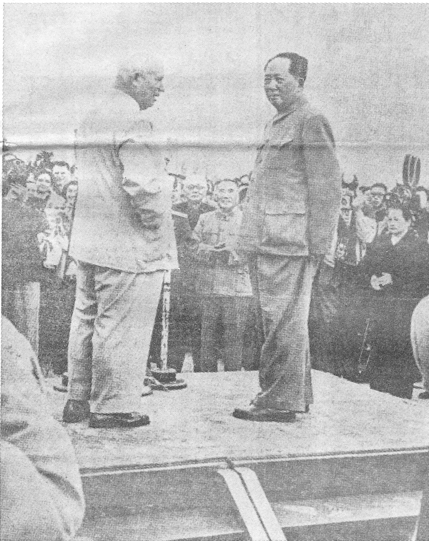
Das hintergründige Symbol der Moskauer Konferenz: Die bösen Geister Chruschtschew und Mao, hier anlässlich ihrer letzten Begegnung 1959 in Peking. Das Podium der brüderlichen Begegnung wurde zum kalten Kriegsschauplatz.

Artikel von Laszlo Revesz auf Seiten 2—4